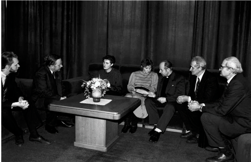
Vertreter der litauischen Minderheit im Kaliningrader Gebiet im Gespräch mit Vytautas Landsbergis 1992.

Der Vertrag mit der Russischen Föderation enthielt auch die Frage nach der westlichen Nachbarschaft. Am gleichen Tag unterschrieben der Ministerpräsident der Republik Litauen, Gediminas Vagnorius, und der Ministerpräsident der Russischen Föderation, Ivan Silajev, die Vereinbarung über die wirtschaftliche und soziokulturelle Zusammenarbeit im Kaliningrader Gebiet. Diese Vereinbarung beinhaltete auch die Zustimmung zur westlichen Grenze Litauens als Grenze zu Russland in diesem Abschnitt. Das ist nichts anderes als „eine echte geopolitische Kuriosität“, denn Litauen bestätigte die Grenze im Westen mit einem im Osten existierenden Staat.