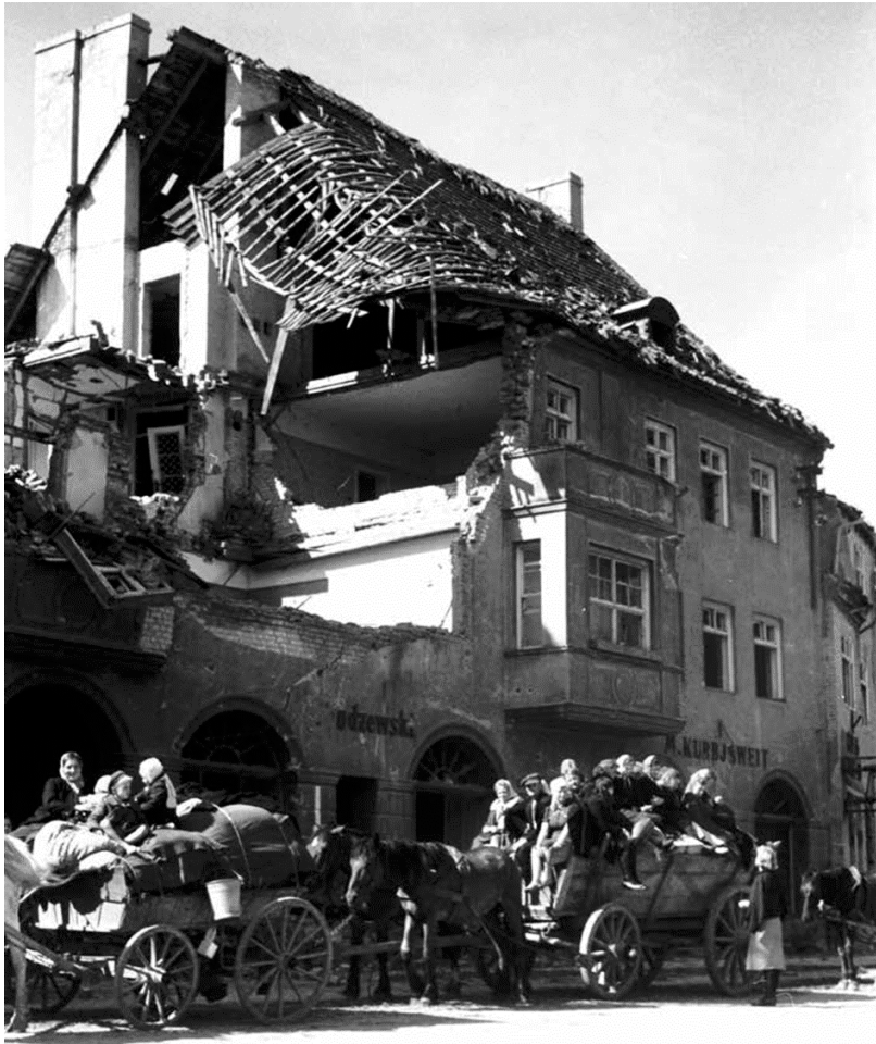
Neusiedler in Eitkūnai (Eydtkuhnen jetzt Černyševskoje), 1945.